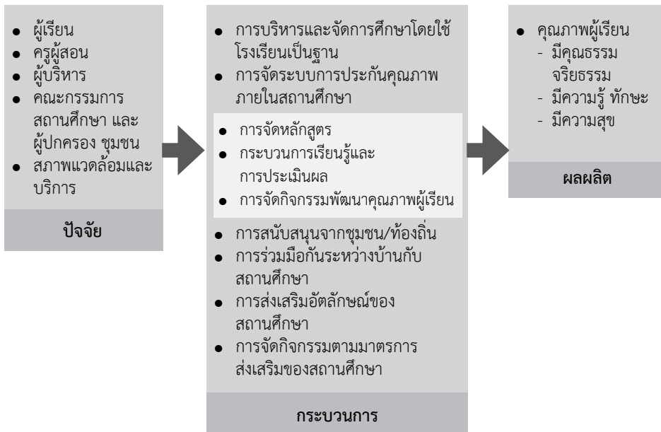
แผนภาพที่ ๑ กรอบแนวคิดในการพัฒนามาตรฐาน

จากข้อสรุปดังกล่าวเมื่อนำมาประยุกต์กับแนวคิดการทำงานเชิงระบบ (System Approach) ซึ่งประกอบด้วย ปัจจัย กระบวนการ และผลผลิต สามารถกำหนดกรอบแนวคิดเพื่อความชัดเจนในการกำหนดมาตรฐานการศึกษาขั้นพื้นฐาน เพื่อให้สอดคล้องกับมาตรฐานการศึกษาของชาติ ดังแสดงในแผนภาพที่ ๑