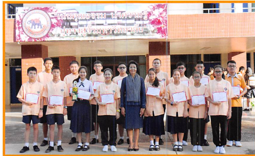
ผลการทดสอบแข่งขันวัดความสามารถทางวิชาการ TOP TEST ประจำปี ๒๕๖๐